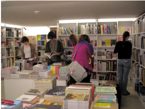
Introductie-opdracht van Abby bij Motta Books, Eindhoven

Ook startten we met het toegankelijk maken van onze programma's voor volwassenen met opdrachtenfolders bij tentoonstellingen en guided tours, waarbij vrijwilligers extra werden geïnformeerd op inclusief taalgebruik en achtergrondinformatie door de curator en educatiemedewerker.