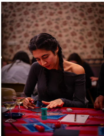
Publiek tijdens de Sip and Make.

Dirk Duif is een Nederlandse ontwerper en beeldend kunstenaar die bekendstaat om zijn opvallende en onconventionele benadering van alledaagse objecten. Zijn werk wordt gekenmerkt door een speels, sculpturaal karakter. Onno Adriaanse is een sculpturale ontwerpstudio die objecten en installaties maakt geïnspireerd door landschappen en hun geologische processen. Onno's werk vindt zijn oorsprong in aspecten van natuurlijke processen zoals de verspreiding over oppervlakten van klimplanten. Teun Zwets is kunstenaar en ontwerper die een werk voltooide opdracht voor het kantoor van de Belastingdienst in Eindhoven. De collectie werd bekend als de Tax Authorities Collection, waar hij een deel van toonde.