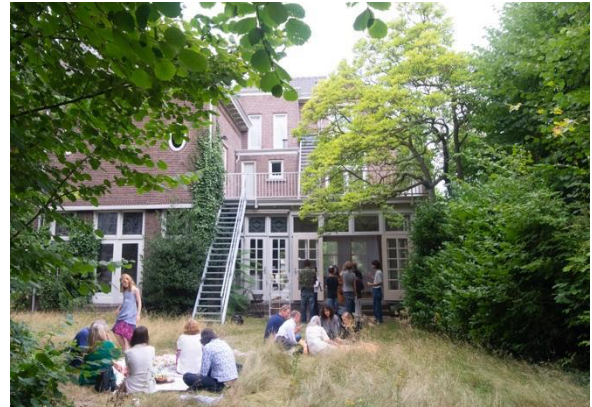
Een van de drie picknick-middagen tijdens de Zomerhuis-residentie

In de werkperiode werd voortgebouwd binnen een methodiek waarin publieke interactie een incentive vormt voor nieuw werk. Het Van Abbehuis daagt haar residenten om het postindustriële landschap van Eindhoven te bevragen en verkennen en verwelkomt jaarlijks zowel internationaal gevestigde namen, als kunstenaars met een lokale focus op participatieve verankering.