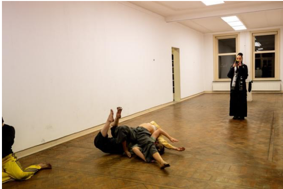
Performance Fontys Dance Arts in Context tijdens Café Wednesday

31 oktober Villa Volta workshop: onder leiding van kunstenaar Marta Tuminska en educatiestagair Maxime Lehnen werden lantaarns gemaakt met kinderen.